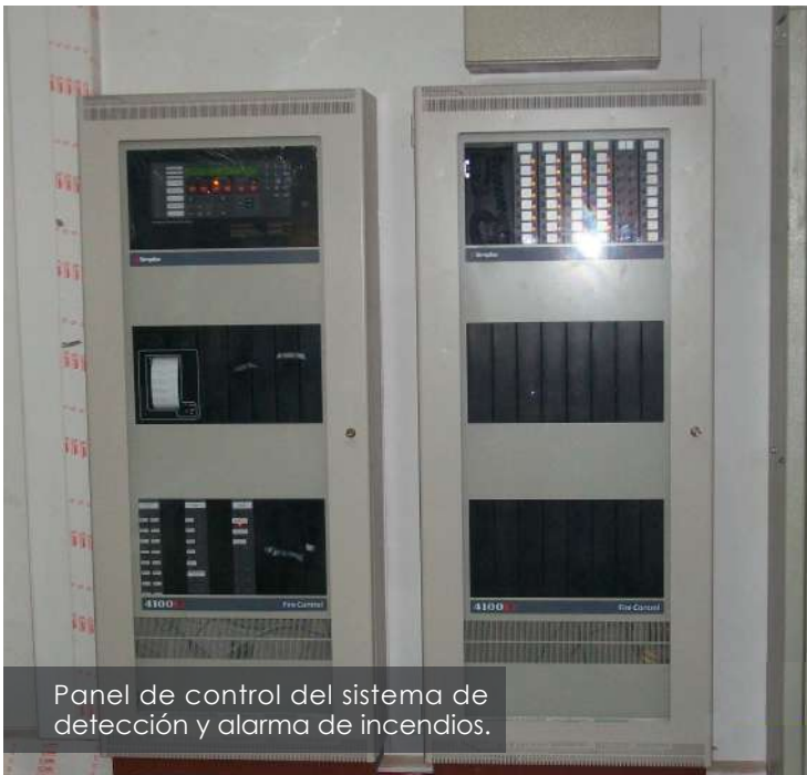
Panel de control del sistema de detección y alarma de incendios.