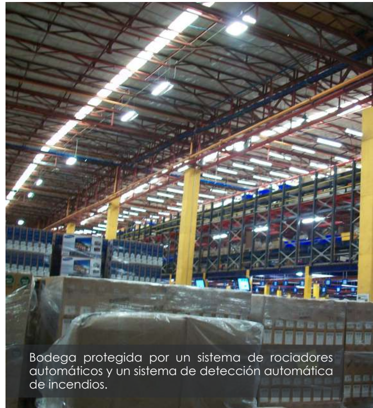
Bodega protegida por un sistema de rociadores automáticos y un sistema de detección automática de incendios.

"A lo largo de los años, hemos contribuido a elevar los estándares de seguridad en la industria, promoviendo una cultura de protección y prevención que ha fortalecido el desarrollo de nuestro sector", añade Chiuminatto.