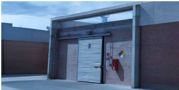
Muro cortafuego en bodega de sustancias peligrosas

Los muros cortafuegos son elementos clave en la protección pasiva contra incendios, garantizando la seguridad de las personas y minimizando daños materiales. Comprender su función y diferencias con los muros divisorios es esencial para aplicar correctamente las normativas y priorizar la seguridad contra incendios.