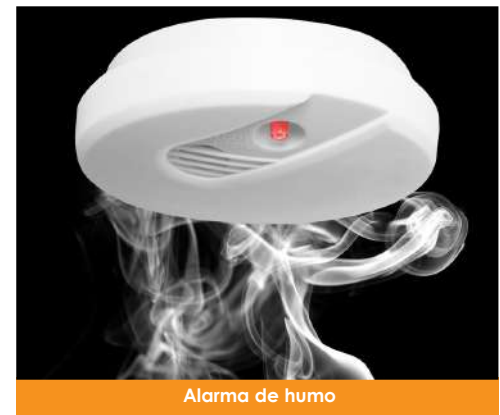
Alarma de humo