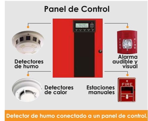
Detector de humo conectado a un panel de control.

Para saber de tipos de detectores ver aquí noticia “Recomendaciones de ANAPCI para Elegir un Detector de Humo: Toma una buena decisión”