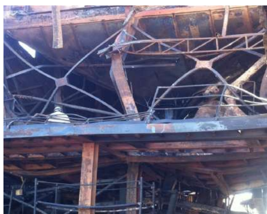
Estructura sometida a incendio real.

Los parámetros de respuesta generados a partir del análisis térmico y estructural pueden ser utilizados para chequear la estabilidad o integridad de un miembro estructural, por ejemplo, falla por deformaciones térmicas o reducción de la resistencia y rigidez de los materiales (en acero y/o hormigón).